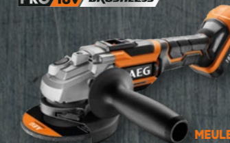
MEULEUSE 125 18V Batterie (non fournie): 18V Disque: Ø 125 mm Vitesse: 11 000 tr/min Capacité de tronçonnage: 26 mm Réf: 4935464414 (1)