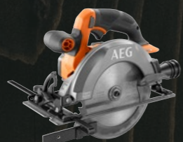
SCIE CIRCULAIRE 18V Batterie (non fournie): 18V Lame: Ø 165 mm Vitesse: 5 000 tr/min Capacité 90°: 57 mm Coupe biaisée : 0 à 50° Poids avec batterie: 2,9 kg Réf: 4935479660 (1)