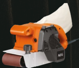
PONCEUSE À BANDE Puissance : 1100 W Largeur : 100 mm Référence : 4935413530