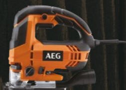
SCIE SAUTEUSE Puissance : 700 W Capacité max bois tendre : 100 mm Changement de lame FIXTEC Réf : 4935451000