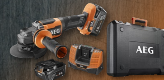
MEULEUSE Ø 125 mm 18V BEWS18-125BLPX2-602C