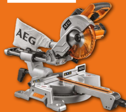
PS216L3 SCIE RADIALE LAME Ø 216 mm