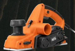
RABOT Puissance : 700 W Vitesse à vide : 17 000 tr/min Profondeur rabotage : 3,0 mm Largeur rabotage : 82 mm Réf : 4935472008