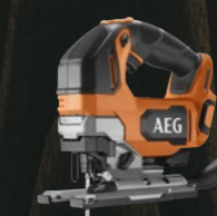
SCIE SAUTEUSE 18V Batterie (non fournie): 18V Vitesse à vide : 3 500 cps/min Course : 25,4 mm Coupe biale : 0 à 45° Capacité max bois tendre : 135 mm Poids : 2,4 kg Réf : 4935492484