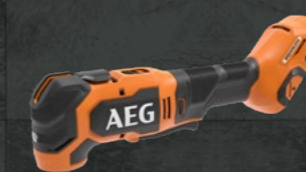
MULTITOOL BRUSHLESS 18V Batterie (non fournie): 18V Angle oscillation D/G: 4° Oscillation: 20 000 osc/min Réf: 4935498157 (1)