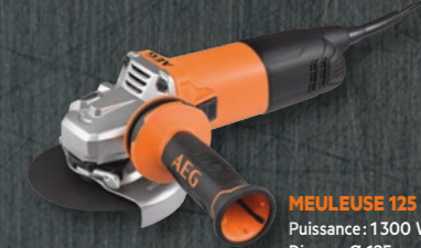
MEULEUSE 125 Puissance: 1300 W Disque: Ø 125 mm Vitesse: 2800 à 11500 tr/min Capacité de tronçonnage: 31 mm Poids: 2,5 kg Anti-redémarrage Écrou FIXTEC Réf: 4935451309