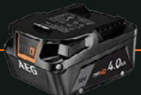
Batterie 18V 4.0 Ah SHD 4935478859