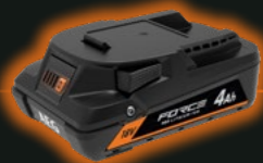
Batterie 18V 4.0 Ah THD 4935499438