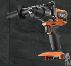
PERCEUSE VISSEUSE À PERCUSSION 18V Batterie (non fournie): 18V Couple: 141 Nm Vitesse: 0 à 2 000 tr/min Percussion: 0 à 32 000 cps/min Poids sans batterie: 2,5 kg Réf: 4935481042