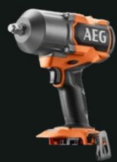
BOULONNEUSE À CHOCS 18V Batterie (non fournie): 18V Couple: 1 220 Nm Vitesse: 0 à 1 900 tr/min Frappe: 0 à 2 300 cps/min Nbre modes: 3 + autostop Réf: 4935493429 (1)