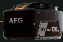
Batterie 18V 12.0 Ah SHD 4935493535