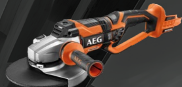
MEULEUSE 230 18V Batterie (non fournie): 18V Disque: Ø 230 mm Vitesse: 5 500 tr/min Capacité de tronçonnage: 68 mm Poids: 5,0 kg Réf: 4935459735 (1)