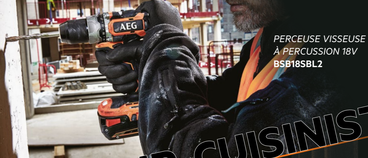
PERCEUSE VISSEUSE À PERCUSSION 18V BSB18SBL2