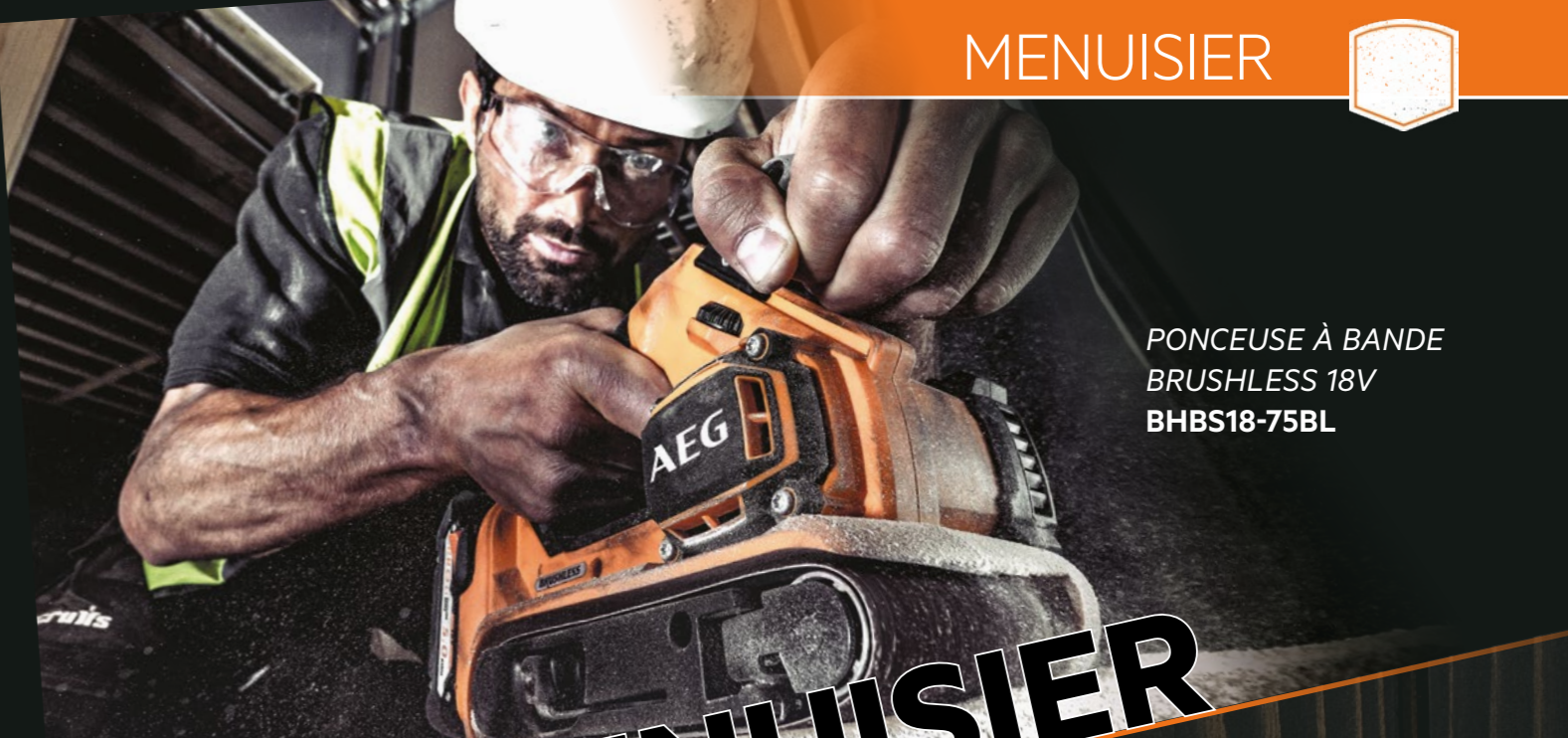
PONCEUSE À BANDE BRUSHLESS 18V BHBS18-75BL