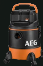
ASPIRATEUR DE CHANTIER 18V Système DUAL : 1 ou 2 batteries 18V Cuve : 20 litres Dépression : 12 Kpa Débit d'air : 1500 L/min Réf : 4935498754 (1) Disponible février 2025