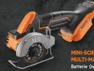
MINI-SCIE MULTI-MATERIAUX 18V Batterie (non fournie): 18V Disque: Ø 76 mm Vitesse: 20 000 tr/min Poids: 1,2 kg Réf: 4935472280 (1)