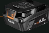
Batterie 18V 6.0 Ah SHD 4935480049