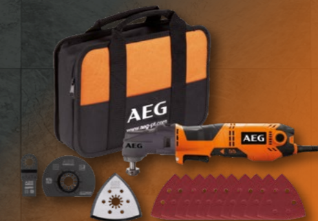
MULTITOOL 300 W OMNI300KIT1