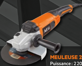
MEULEUSE 230 Puissance: 2 200 W Disque: Ø 230 mm Vitesse: 6 600 tr/min Capacité de tronçonnage: 68 mm Poids: 5,2 kg Réf: 4935431730