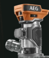
AFFLEUREUSE 18V Batterie (non fournie): 18V Pinces : Ø 6 mm Vitesse : 17 000 à 30 000 tr/min Nbe vitesses : 7 Profondeur de fraisage : 36 mm Réf : 4935493555