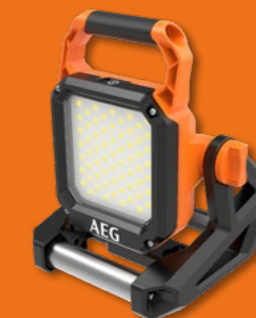
BAL18-0 (1) PRO 18V PROJECTEUR DE CHANTIER 18V