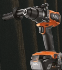
PERCEUSE-VISSEUSE A PERCUSSION 18V 2 Batteries 18V 6,0 Ah HD Couple: 141 Nm Vitesse: 0 à 2 000 tr/min Percussion: 0 à 32 000 cps/min Poids avec batterie: 2,5 kg Réf: 4935481043 (1)