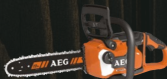
TRONÇONNEUSE 18V Batterie (non fournie): 18V Guide: 30 cm Vitesse de chaîne: 10 m/s Poids sans batterie: 4,0 kg Réf: 4935471337 (1)