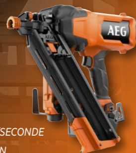
CLOUEUR DE CHARPENTE 10GA 34° BRUSHLESS 18V BF18FN10-0 (1)