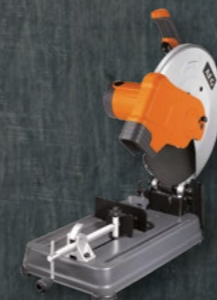
TRONÇONNEUSE À MÉTAUX 355 mm Puissance: 2300 W Disque: Ø 355 mm Vitesse: 4 280 tr/min Poids: 16,5 kg Livré avec: Disque, étai Réf: 4935411770