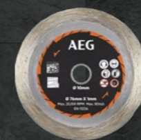
DISQUE CÉRAMIQUE idéal avec mini scie multimatériaux Ø 76 mm Réf: 4932478589