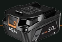
Batterie 18V 5.0 Ah SHD 4935478860