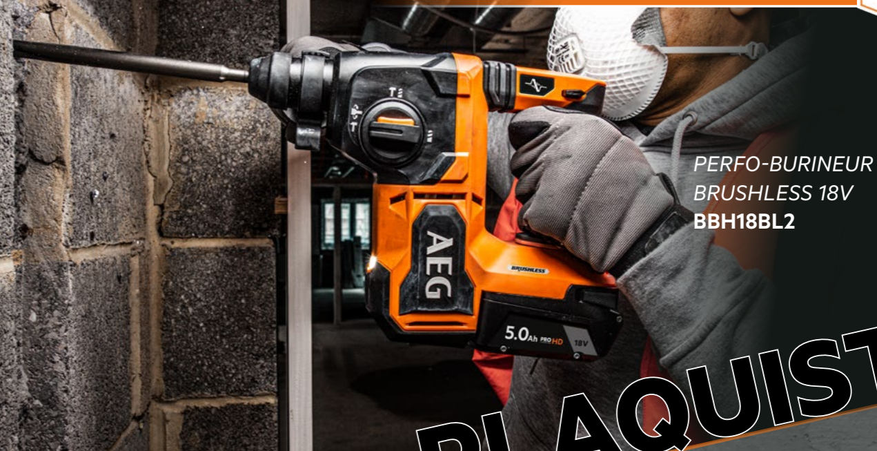
PERFO-BURINEUR BRUSHLESS 18V BBH18BL2