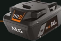
Batterie 18V 8.0 Ah SHD 4935480050