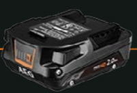
Batterie 18V 2.0 Ah SHD 4935478858