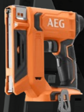
AGRAFEUSE 18V Batterie (non fournie): 18V Chargeur: 88 agrafes Longueur agrafe: 6,35 à 14,3 mm Largeur agrafe: 9,5 mm Poids avec batterie: 1,81 kg Réf: 4935480969 (1)