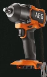
BOULONNEUSE À CHOCS 18V Batterie (non fournie): 18V Couple: 785 Nm Vitesse: 0 à 2 800 tr/min Frappe: 0 à 3 800 cps/min Nbre modes: 3 + autostop Réf: 4935479663 (1)