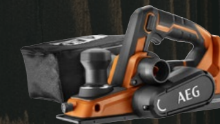
RABOT 18V Batterie (non fournie): 18V Vitesse à vide : 14 300 tr/min Profondeur rabotage : 2,0 mm Largeur rabotage : 82 mm Profondeur rainurage : 12,5 mm Réf : 4935464988 (1)