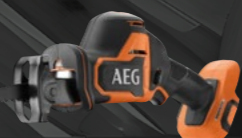
SCIE SABRE 18V Batterie (non fournie): 18V Course: 22 mm Vitesse: 0 à 3 200 cps/min Poids sans batterie: 1,8 kg Réf: 4935479662 (1)