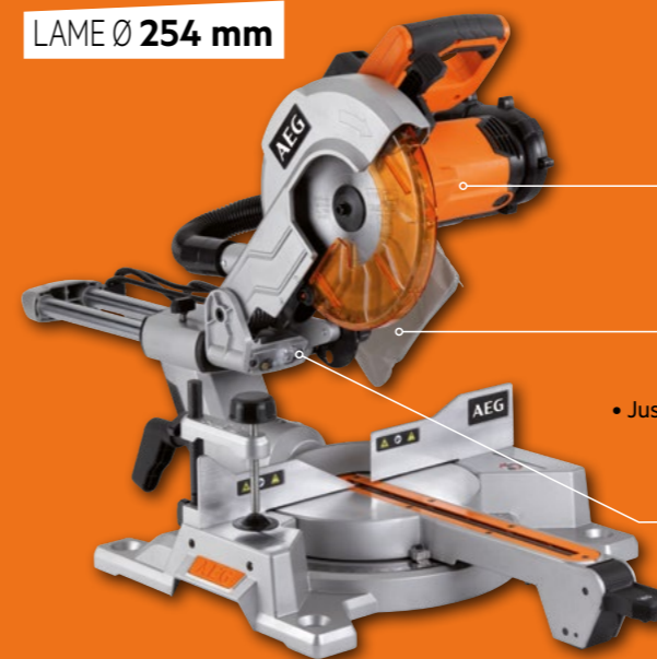
LAME Ø 254 mm