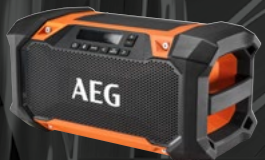
RADIO DE CHANTIER 18V Batterie (non fournie): 18V Fréquence: FM/AM/BT Bluetooth: 30 m Puissance: 2 x 15 W Protection IP: IP54 Réf: 4935479668 (1)