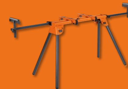
PSU1000 ÉTABLI UNIVERSEL