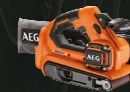
PONCEUSE À BANDE 18V Batterie (non fournie): 18V Bande abrasive : 457 x 75 mm Vitesse : 135 à 300 tr/min Poids sans batterie : 3,4 kg Référence : 4935459582 (1)