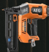
CLOUEUR DE FINITION 16 GA 18V Batterie (non fournie): 18V Clous : 32 à 63,5 mm de longueur Réf : 4935498189 (1)