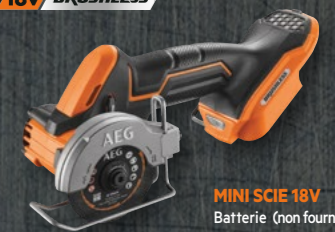
MINI SCIE 18V Batterie (non fournie): 18V Disque: Ø 76 mm Vitesse: 20 000 tr/min Poids: 1,2 kg Réf: 4935472280 (1)