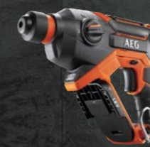
PERFORATEUR SDS+ 18V Batterie (non fournie): 18V Énergie de frappe: 1,5 J Vitesse: 0 à 1 300 tr/min Frappe: 0 à 5 500 cps/min Poids sans batterie: 2,5 kg Réf: 4935464984 (1)