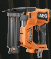
CLOUEUR DE FINITION 18 GA 18V Batterie (non fournie): 18V Clous : 16 à 55 mm de longueur Réf : 4935498188 (1)