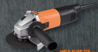
MEULEUSE 125 Puissance: 800 W Disque: Ø 125 mm Vitesse: 12 000 tr/min Capacité de tronçonnage: 31 mm Poids: 1,9 kg Anti-redémarrage Réf: 4935451296