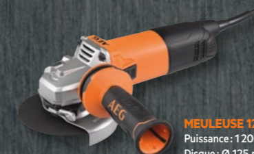
MEULEUSE 125 Puissance: 1200 W Disque: Ø 125 mm Vitesse: 11 500 tr/min Capacité de tronçonnage: 31 mm Poids: 2,4 kg Anti-redémarrage Écrou FIXTEC Réf: 4935451306